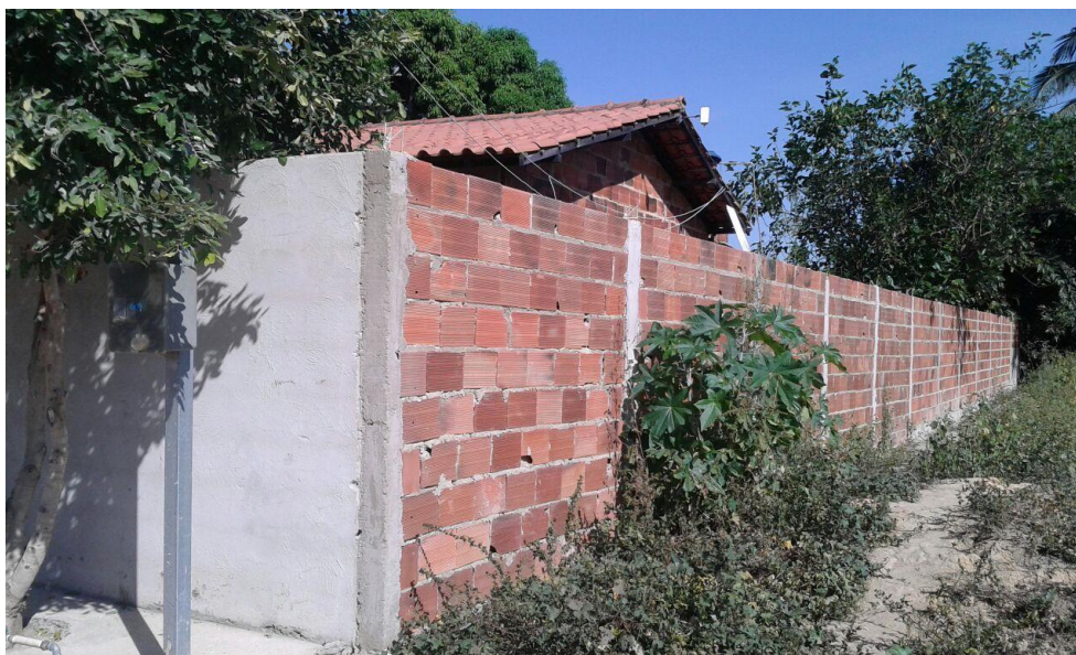
Figura 1. Registro fotográfico da visita.